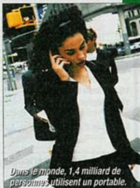
Dans le monde, 1,4 milliard de personnes utilisent un portable.

tion : prouver l'innocuité pour l'homme des champs électromagnétiques dégagés par les téléphones sans fil. Seulement, après six années d'études, les premiers résultats tombent et vont prouver le contraire (risque accru de tumeurs cancéreuses au cerveau ou au nerf auditif, modification de l'ADN...). Ces conclusions contrarient le lobby de la téléphonie sans fil qui va immédiatement chercher à les étouffer. Du jour au lendemain, les crédits accordés à la